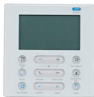
Kabelový ovladač - FKJR 120A pro kazetové, podstropní / parapetní a mezistropní jednotky

Časový spínač může být nastaven pro libovolné zapínání a vypínání klimatizační jednotky kdykoli po dobu 24 hodin.